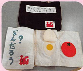
作品名 「なんだろう?」