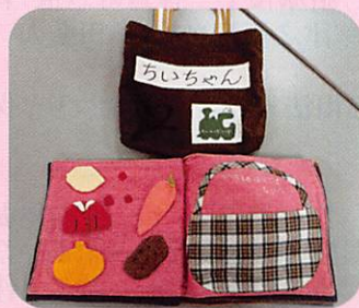
作品名 「ちいちゃん」

問い合わせ先 社協 ボランティアセンター 電話(084) 928-1346 FAX(084) 928-1331