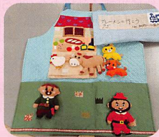
作品名 「ブレーメンに行こう」 (エプロシアター)