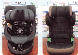
チャイルドシート等(ISOFIX固定方式)