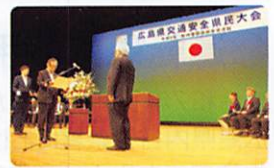
昨年表彰式の様子