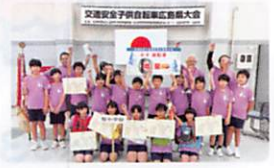
昨年優勝の原小学校チーム