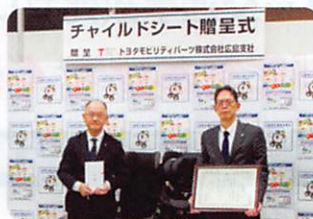
専務理事と今井支社長(右)

3月4日(火)、トヨタモビリティパーツ株式会社広島支社(安芸郡坂町)から、チャイルドシート等(乳幼児用6台、学童用6台)の寄贈がありました。同社からの寄贈は平成22年から行われており、今回で16回目となります。寄贈されたチャイルドシート等は、県内の交通安全協会会員様に無料で貸し出ししております。