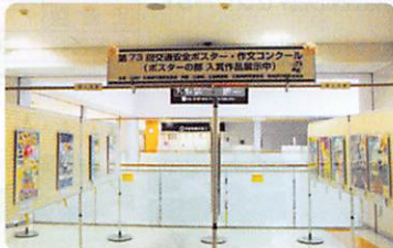
展示会場の様子 (広島県東部運転免許センター)

11月20日(水)から1月16日(木)の期間、広島県東部運転免許センターをはじめ県内5会場において、昨年、小中学生を対象に実施した交通安全ポスター・作文コンクールで広島県知事賞などを受賞したポスター優秀作品27点を展示し、多くの方々に鑑賞していただきました。ご協力いただいた会場施設の方々に感謝するとともに、大人も子供たちの「交通安全の願い」を实践されますよう祈念いたします。また、次回のコンクールもすばらしいポスターや作文の応募をお待ちしています。