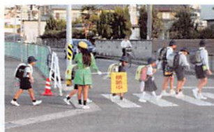
毎月1日、15日の横断指導