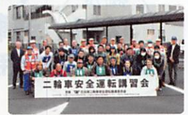
昨年講習会の様子