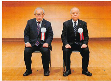
全国自治会連合会表彰