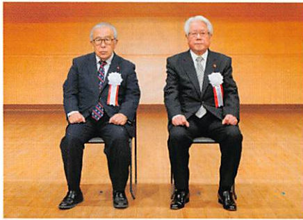
春の叙勲 旭日単光章