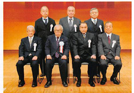
あけぼの基金要綱に基づく表彰