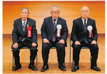
地域自治活動功労者に対する感謝状贈呈