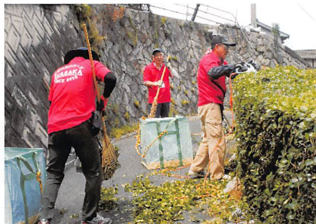
生活支援グループが生垣剪定活動中

現在、福山道路建設工事により、豊かな農村風景は一変し、通勤や通学に危険を感じることも多々あ