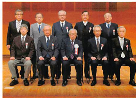
自治会(町内会)長の部