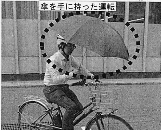
傘を手に持った運転

傘を手に持って運転することは、視野を妨げたり、安定を失うおそれがあることから禁止