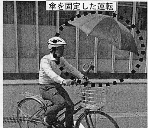
傘を固定した運転

傘を手に持って運転することは、視野を妨げたり、安定を失うおそれがあることから禁止