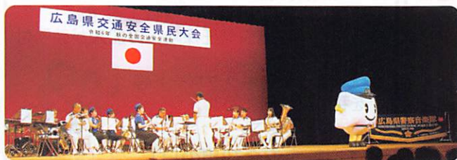
広島県警察音楽隊による演奏の様子