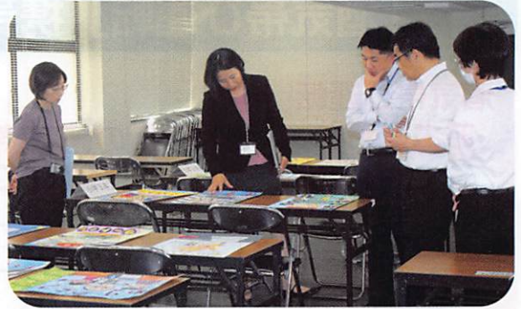
最終審査の様子(ポスターの部)

広島県内の小・中学生を対象に、交通安全ポスターと作文のコンクールを開催しました。小・中学校からポスター6,575点、作文824点の応募があり、審査の結果、広島県知事賞などの各賞が決まりました。ポスターの部で、特に優秀と認められた作品27点(銀賞以上)を、次の5会場で展示する予定です。是非、お近くの会場でご覧ください。また、作文の金賞以上の作品については、ご希望されたご本人による朗読を春の全国交通安全運動が実施される4月にRCCラジオで放送する予定です。