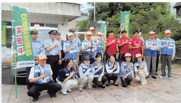
横川駅街頭キャンペーン(スカイアクティブ選手とともに)

交通事故の無い安全で快適な交通社会は誰もが望んでいるところであり、当協会としましては、広島西警察署をはじめとする関係機関・団体等と緊密な連携を図りながら、交通事故防止に関する啓発活動など、積極的な交通安全活動を展開してまいります。