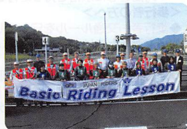
受講されたみなさん

10月6日(日)、広島県運転免許センターで開催されました。当日は天候に恵まれ、10名のライダーが参加し、白バイ隊員や指導員から安全確認の重要性、合図のタイミングなどの安全走行やコンビネーションスラローム、ブレーキングなどの技能走行に関することについて学びました。