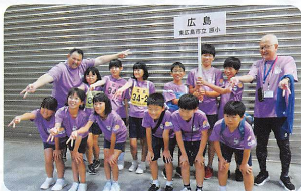
全国大会出場の原小学校のみなさん