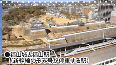
●福山城と福山駅 (新幹線のぞみ号が停車する駅)