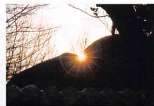
お月さんの割れ目から昇る冬至の朝日