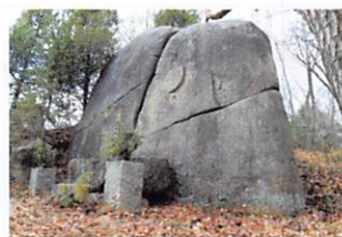
月天菩薩の刻字あり(表)

そうした中で御野学区では、住民一人ひとりが、我が家がどのような場所に建ち、どのような災害に弱いかを常に考え暮らすことの大切さを再認識し、災害に強いまちづくりをめざしています。