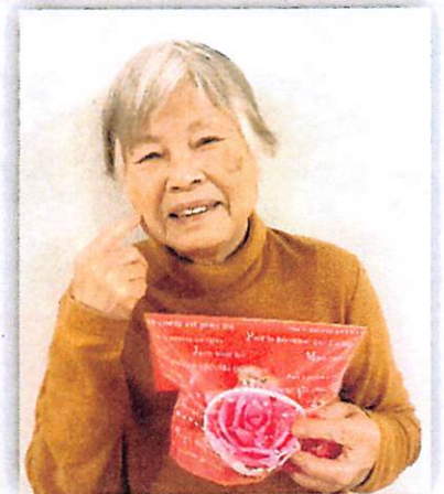
バラの飾りを🎁プレゼントです