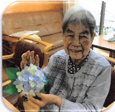
あじさいの飾り～ステキでしょう？