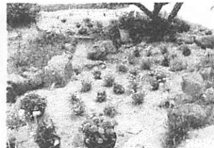
造成中の花の園 (4/25撮影)