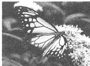
アサギマダラとフジバカマ

11:00または14:00に明王院下駐車場にご集合ください。見学所要時間約30分。