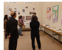
【沼隈郷土文化瀧之助研究会】

【問合せ先】 福山市まちづくり推進部 まちづくり推進課 TEL (084) 928-1243 FAX (084) 928-1229