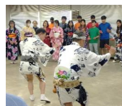
【福山市古典芸能保存会】