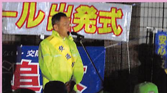
福山市長あいさつ

12月1日(金)から10日(日)までの10日間、年末交通事故防止県民総ぐるみ運動を実施しました。