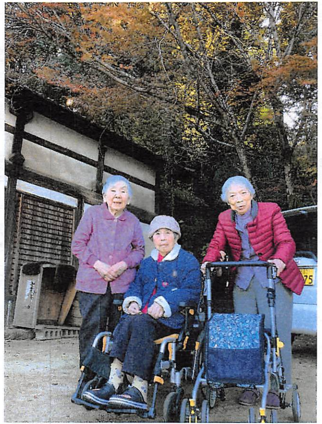
明王院の「本堂」と「五重塔」は国宝です。すてきですね♡