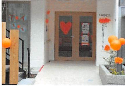
地域包括支援センター野上

9月は「世界アルツハイマー月間」でした。その中でも9月21日は「アルツハイマーデー」であり、それにちなみ、アボーデひかりでオレンジデーが開催され、包括野上の事務所もオレンジ色で飾り付けをしました！