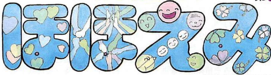
題字デザインは松岡恵子さん