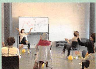
16. 脳トレ&ストレッチ