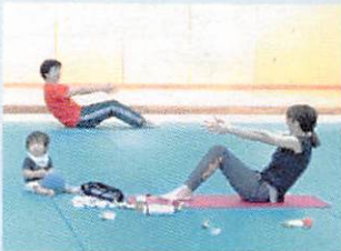
11. 産後のママシェイプ