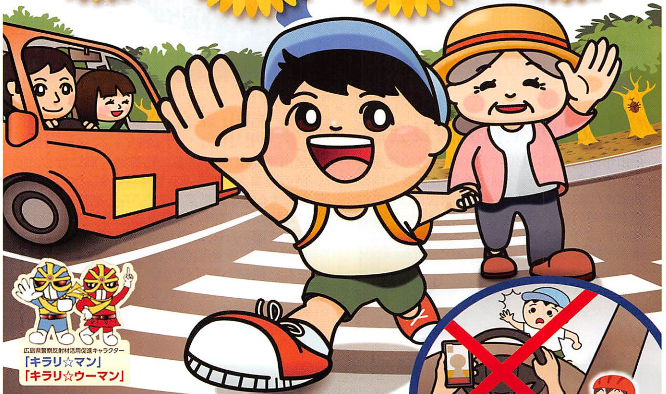
広島県警察反射材活用促進キャラクター 「キラリ☆マン」 「キラリ☆ウーマン」