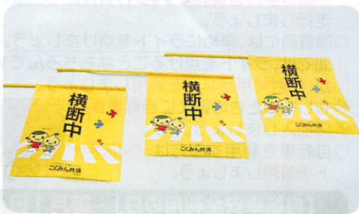
寄贈された横断旗

5月31日(火)、こくみん共済 coop広島推進本部から、「交通事故防止に役立ててもらいたい」と横断旗3,000本を寄贈していただきました。寄贈は、平成31年から継続して行われております。この横断旗は、県内の各地区交通安全協会に分配し、通学路や横断歩道などで活用し、歩行者の交通事故防止活動に利用させていただいております。