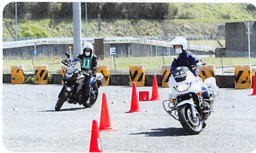
白バイ隊員からアドバイスを受ける受講生

4月17日(日)、広島県運転免許センターで開催しました。天候に恵まれ、30名の男女が参加しましたが、今回は、50歳以上のベテランライダー・リターンライダーが3分の2を占めました。参加者は、白バイ隊員や指導員から安全走行に関することや、スラローム等の技能走行を学びました。 *次回は、9月25日(日)を予定しております。