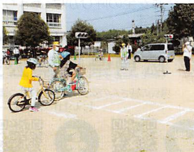
小学生に対する自転車教室の様子

新型コロナウイルス感染症の流行も3年目を迎えます。そうした状況の中にあっても、何回かの中止もありましたが、春、夏、秋、年末の交通安全運動開始式をはじめ、児童・生徒に対する自転車の安全な乗り方や正しい道路の渡り方などを指導する、交通安全教室を市内のほとんどの小中学校で実施しております。