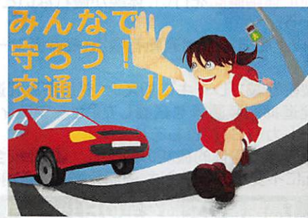
「第70回広島県知事賞」受賞作品(ポスターの部)