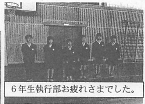
6年生執行部お疲れさまでした。

れました。5年生新執行部は、2, 3月の目標を「6年生と記憶に残る楽しい思い出を作りえがおで送り出そう」とし、今できる最高の六送会にしようと考えています。先日も、登校途中に調子の悪くなった1年生を心配し、6年生が家まで送ってくれたということがありました。みんなのことを考えて動いてくれた6年生に感謝の気持ちを伝え、中学校へ送り出したいと思います。