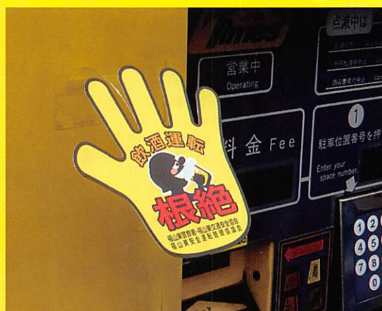
精算機の手形ポップ