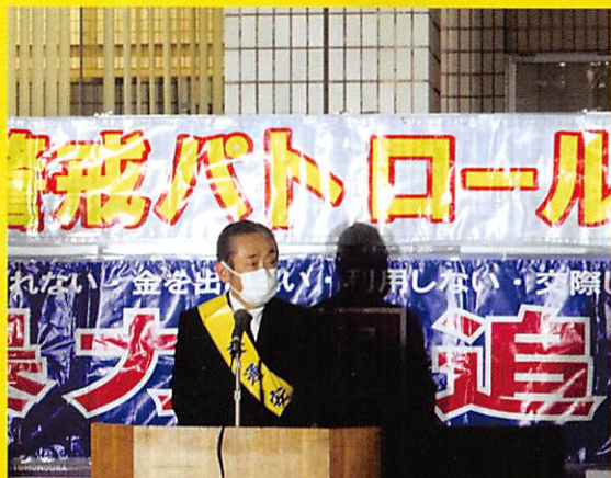
小丸会長あいさつ