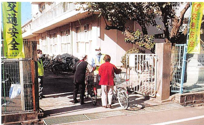
霞学区 交通安全活動