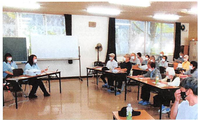
西深津学区 交通安全教室