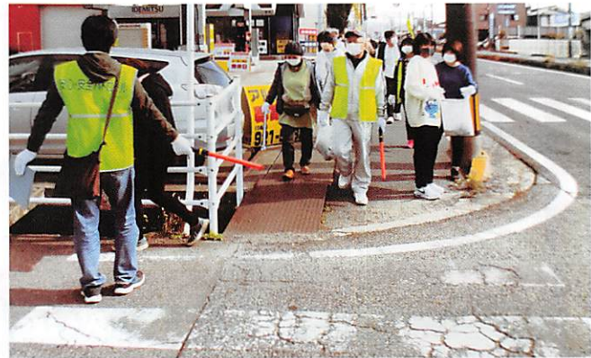
手城学区 清掃活動