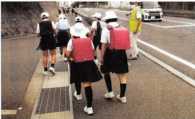
伊勢丘学区 交通安全通学指導