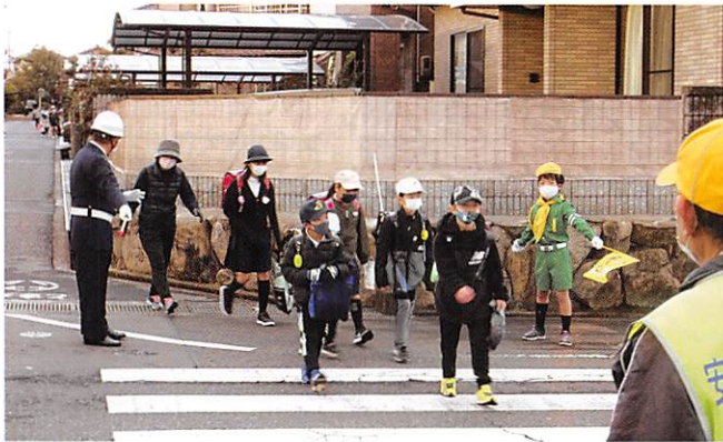
坪生学区 交通少年団