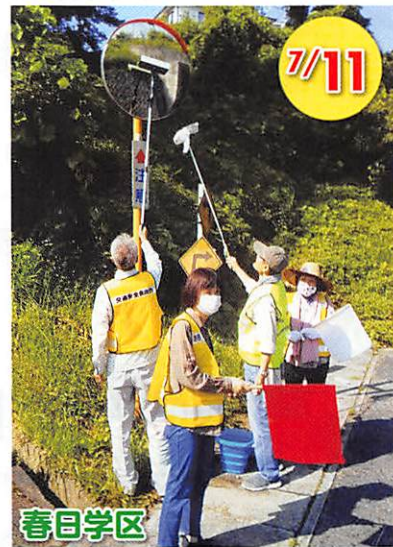
春日学区 交通安全活動(カーブミラー清掃)