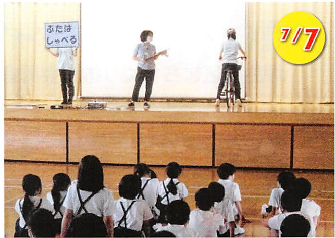
南学区 自転車乗り方教室