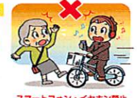
スマートフォン・イヤホン禁止