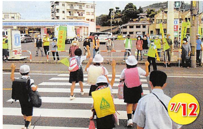
西深津学区 通学路の見守り