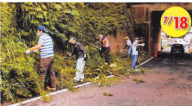
伊勢丘学区 交通安全活動(通学路の草刈り)