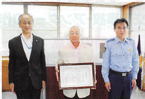
伝達の様子(島本前会長)