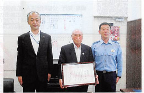
伝達の様子(中原前会長)