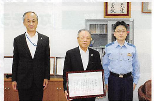
伝達の様子(塚本前会長)