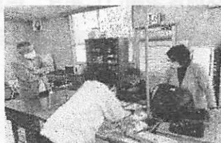
【木版画ローラーの会】