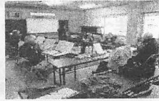
【深津ハーモニカサークル】

【問合せ先】 福山市役所まちづくり推進部 人権・生涯学習課 TEL(084)928-1243 FAX(084)928-1229