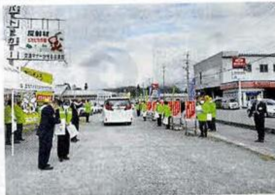
テント村で交通安全キャンペーンの実施

昨年は、新型コロナウイルスの影響で交通安全活動を自粛、縮小することとなり、今年も、現状では見通しが立たない情勢ですが、一人一人が交通ルールの遵守と人に優しい交通マナーを実践することによって、安全で安心な交通社会が実現できるよう、各種活動に取り組んでまいります。