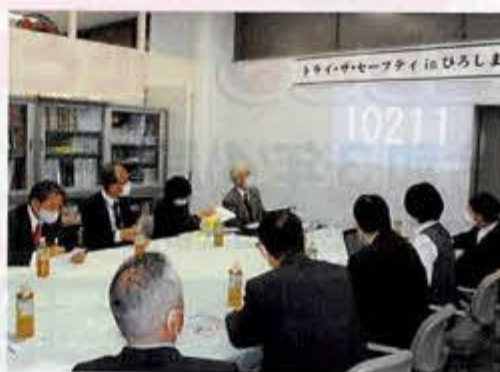
副賞抽選会の様子

5人1組で150日間無事故無違反運動に12,410チームが挑戦し、この内10,436チームが達成(達成率84.1%)されました。