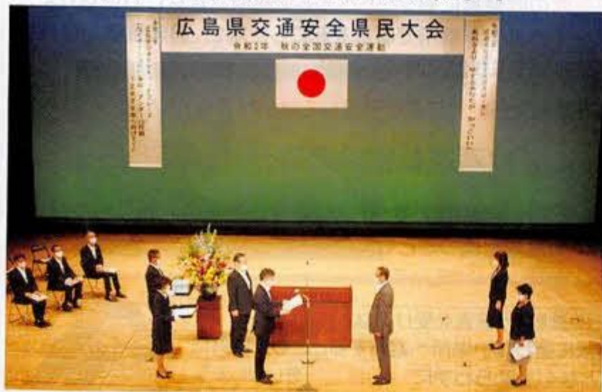
昨年の表彰式の様子